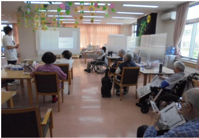
健康セミナーの当日様子

圧迫骨折の基本的な知識や予防の方法などについて話していただき、参加者の皆様は熱心に聞いておられました。